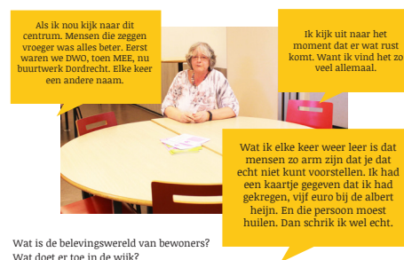
Wat is de belevingswereld van bewoners? Wat doet er toe in de wijk?

‘Niet iedereen herkent zich in de toekomst-verhalen die politici en beleidsmakers vertellen. De energietransitie is ook zo’n verhaal.’