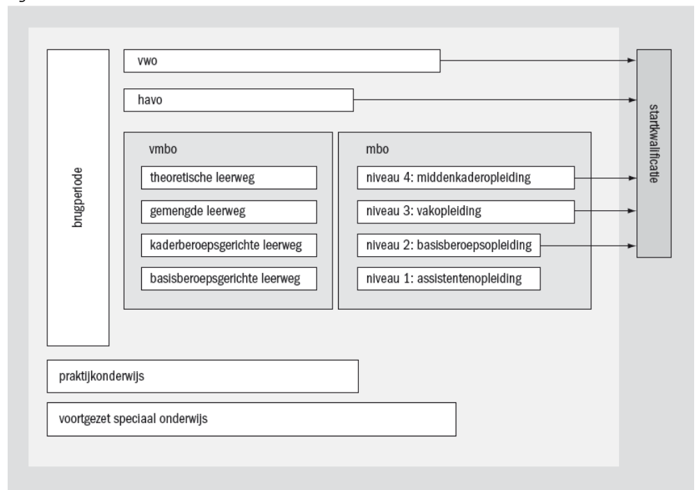
Figuur 1 Routes naar een startkwalificatie